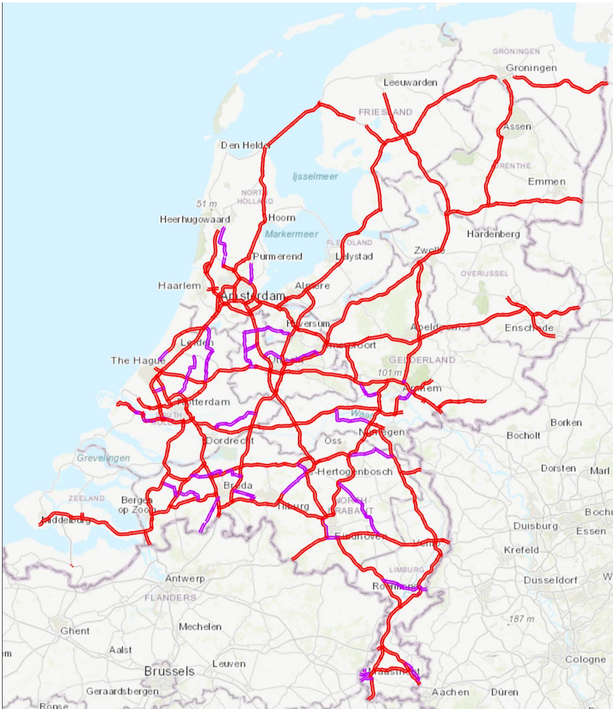
Figuur 4.1 Voorstel heffingsnetwerk op basis van regionale inbreng. In rood zijn de autosnelwegen ingetekend en in paars de niet-autosnelwegen.