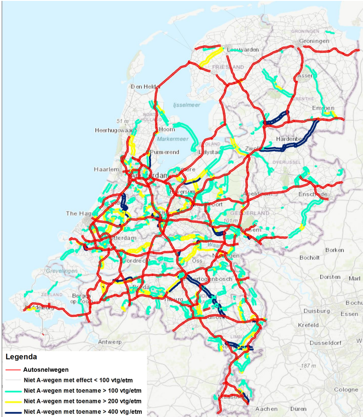
Figuur 3.2 Modelresultaten van het uitwijkende vrachtverkeer bij heffingsnetwerk A samengesteld uit alleen autosnelwegen.